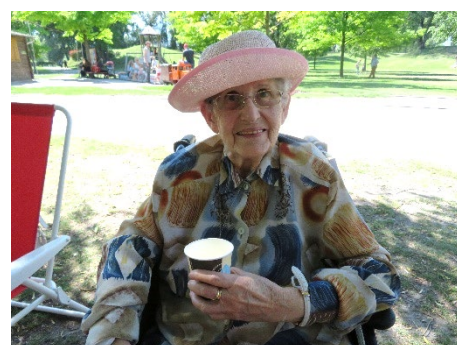
Sortie aux Iles à Sion