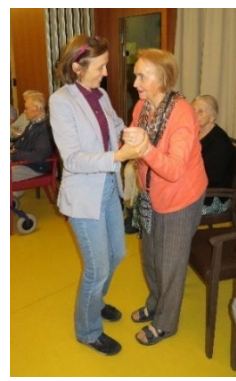
Fête du foyer le 4 mai